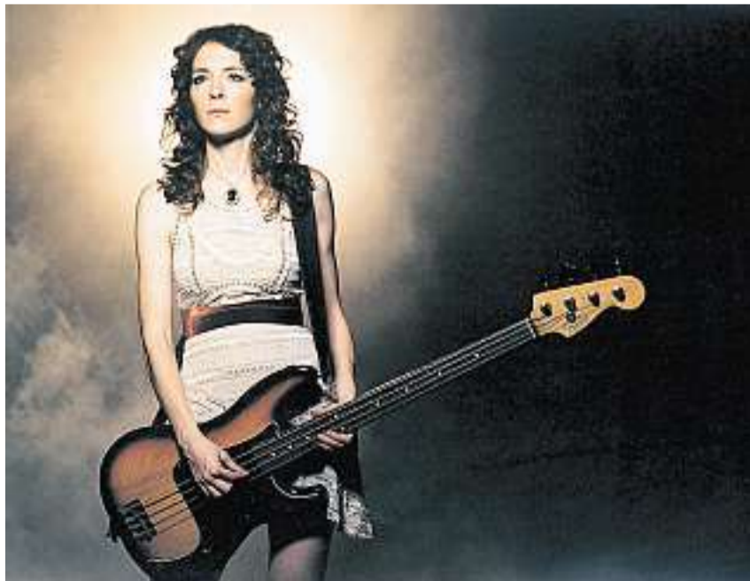
Spielt heute in Brunnen: Der kanadische Rockstar Melissa Auf der Maur.

Schwyz. – Als Bassistin und Sängerin ist Melissa Auf der Maur in der alternativen Rockmusikszene weltweit bekannt. Was viele nicht wissen: Der kanadische Rockstar hat Schwyzer Wurzeln. Ihre Grosseltern wanderten vor Jahren nach Kanada aus, wo schliesslich auch Melissa aufwuchs. Die Musikerin kann zwar weder Schweizerdeutsch sprechen, noch hielt sie sich länger in der Schweiz auf, trotzdem ist sie enorm stolz auf ihre Wurzeln und den Namen Auf der Maur, wie sie im heutigen «Samstagsgespräch» durchblicken lässt. Heute Abend spielt sie im Espas (alter Kinosaal) in Brunnen. (nic) SEITE 7