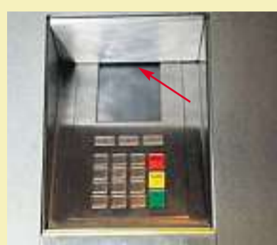
Manipulierter Billettautomat: Eine Minikamera erspäht den PIN-Code.