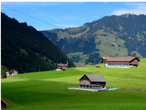
Die Liegenschaft Mur, Richtung Norden