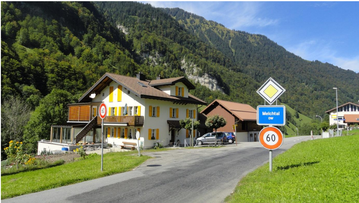
Fruttstrasse 32, Bushaltestelle Plätzli, 6067 Melchtal.