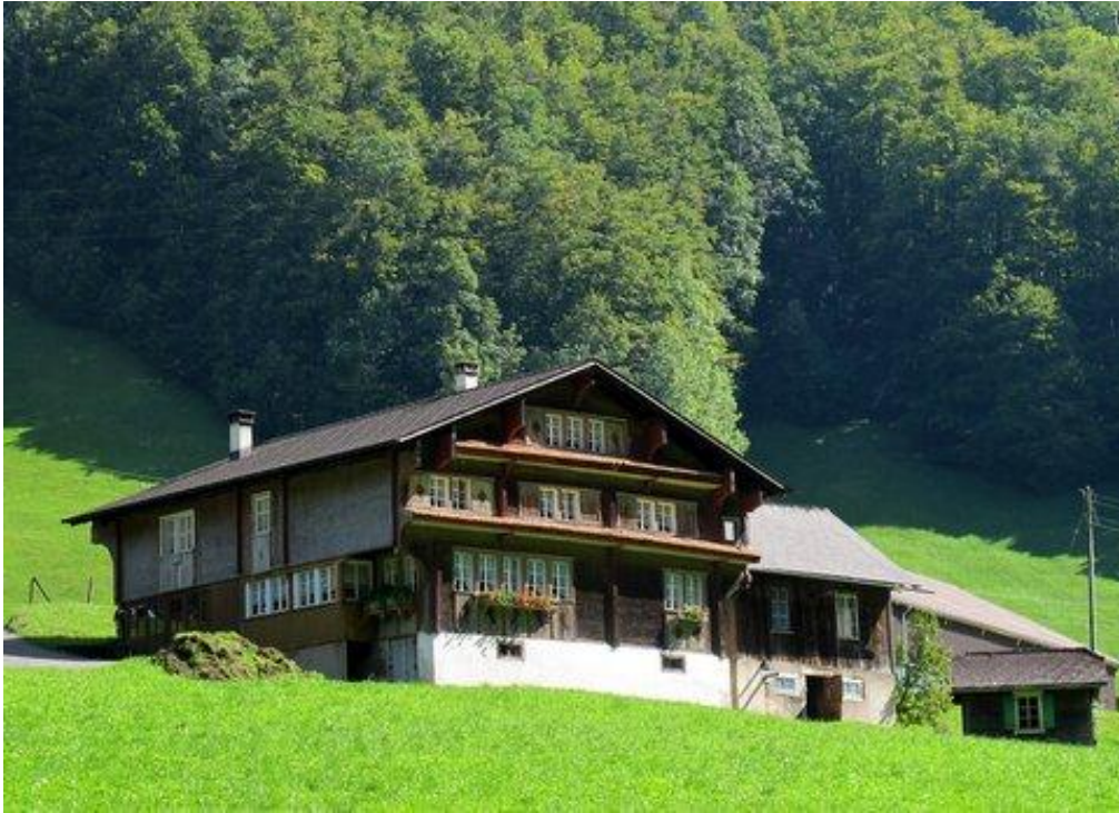
Der vordere Teil der Mur, östlich der Strasse (vermutlich das ältere Mur – Haus)