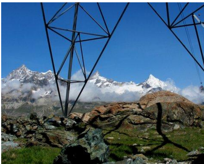
Der Seilbahnmasten am oberen Ende der „Uf der Mur“ mit dem Obergabelhorn, Wellenkuppe, Zinalrothorn und Weisshorn. (von links)