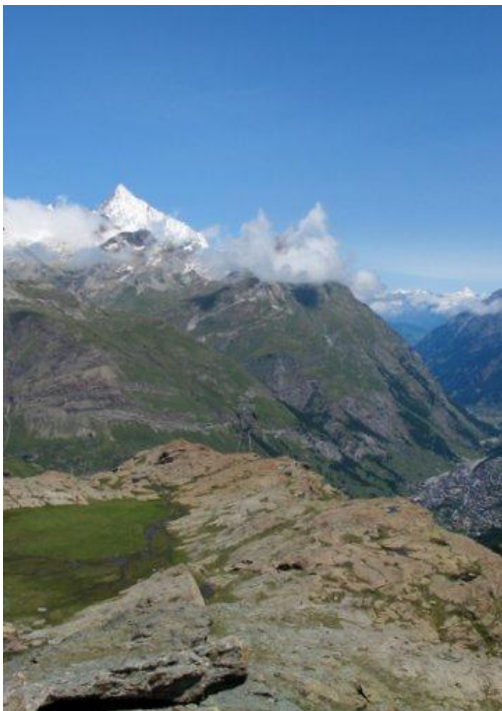
Die „Uf der Mur“ mit dem Weisshorn