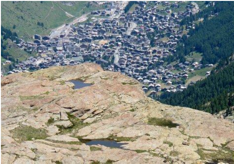
Das rötliche Felsband „Uf der Mur“ oberhalb Zermatt