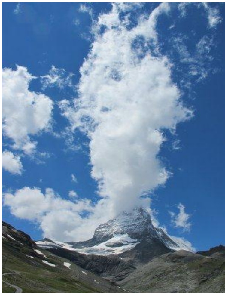
Das Matterhorn mit Wolkenturm